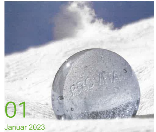
01 Januar 2023

Die große Mehrheit der Befragten im ZDF-„Politbarometer“ ist zum Beispiel der Meinung, dass Deutschland bei der Energieversorgung gut durch den Winter kommen wird. Viele Deutsche erwarten persönlich ein